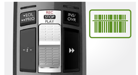
Interrupteur à curseur (enregistrement, arrêt, lecture, retour rapide)